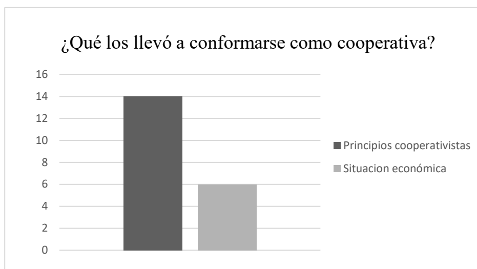
Gráfico 1. Motivos para la conformación de la cooperativa