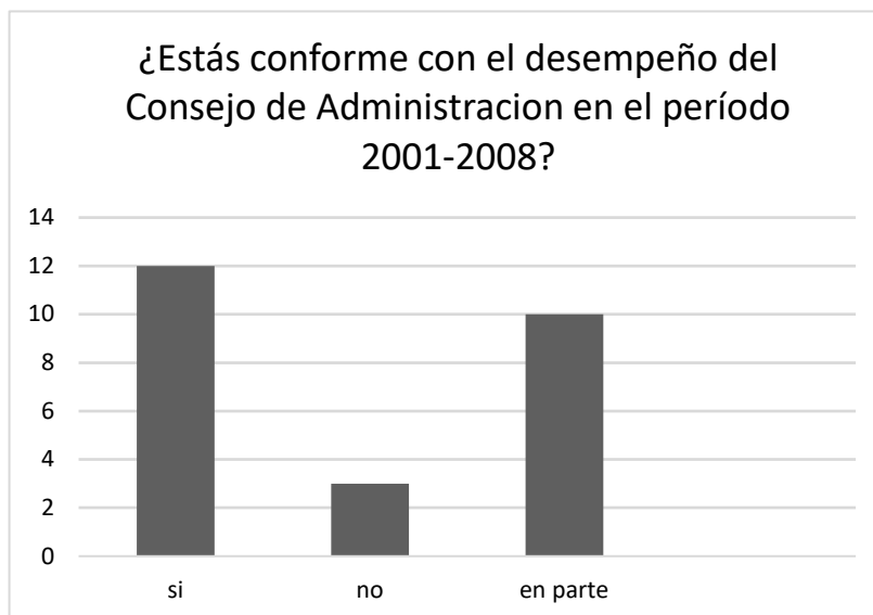
Gráfico 3 Conformidad con el desempeño del Consejo de Administración