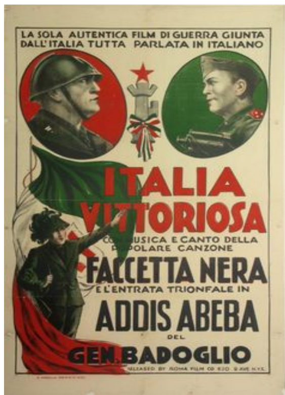
Cartel de propaganda «Italia Vittoriosa»