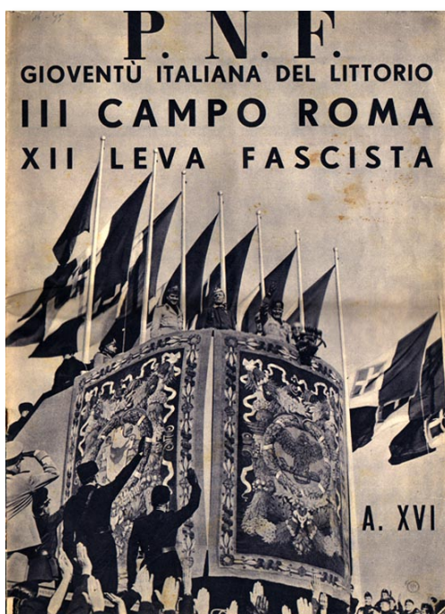
Figura 4 Propaganda política dirigida a los jóvenes fascistas

Nota: «El Duce de todas las victorias» «Vencer y venceremos» lemas clásicos del fascismo.