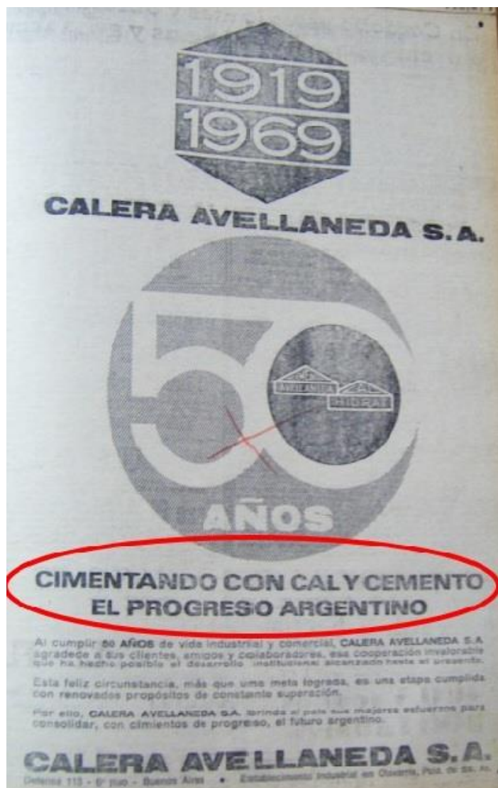
Figura 4. Publicidad publicada a página completa en el Diario Tribuna.

Durante el período se observó también en el periódico la presencia de publicidades que transmiten en su mensaje algunos de los valores destacados en la construcción de las noticias, por el ejemplo, la idea de “progreso” (Figura 4).