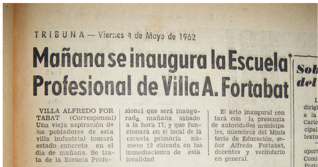
Figura 3: Noticia sobre inauguración en la Villa A. Fortabat

En el año 1962, por su parte, las notas también destacan las nuevas edificaciones puestas al servicio de los vecinos de la Villa “Alfredo Fortabat”: por un lado, la escuela profesional industrial que se valora por ser “la aspiración de la población de esta villa” y, por el otro, la sociedad de fomento (que en este año está en proceso de construcción) que también se describe como surgida a partir del “ interés reinante entre el vecindario”. En ambos casos, el mensaje que atraviesa el relato periodístico se centra en las obras como formando parte de “todo lo necesario para que la naciente población tenga las comodidades indispensables” y, a su vez, para lograr que la villa “se constituya en otra de las localidades verdaderamente progresistas del partido”.