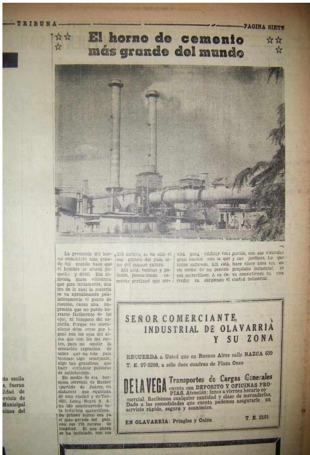
Figura 2: Noticia sobre la inauguración de horno cementero.

avance de la empresa cementera. Casualmente el texto la coloca en un lugar central cuando describe que “a su derredor va surgiendo el pueblo con sus viviendas y jardines”, instalando un sentido de localidad construida como consecuencia directa de la presencia de la industria en el lugar. Tal como expone el relato “lo que antes era un propósito industrial se va convirtiendo en una ciudad industrial”, reforzando un significado de ciudad, en desmedro de otros aspectos posibles de destacarse como representativos de esta.