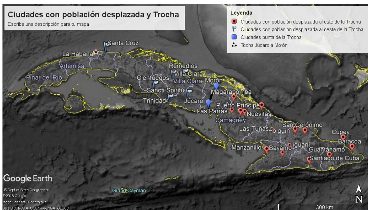
FIGURA 1: Principales ciudades con población desplazada de manera forzosa. Elaboración propia sobre plataforma de Google Earth.

De esta forma, las ciudades que se destacaron por recibir población desplazada de manera forzosa pueden ser vistas en el siguiente mapa: