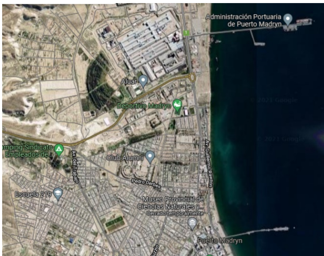
Mapa 2: Ubicación de los dos muelles de Madryn

Arriba, en la imagen, el muelle Storni, articulado con ALUAR. Debajo el muelle Piedrabuena.