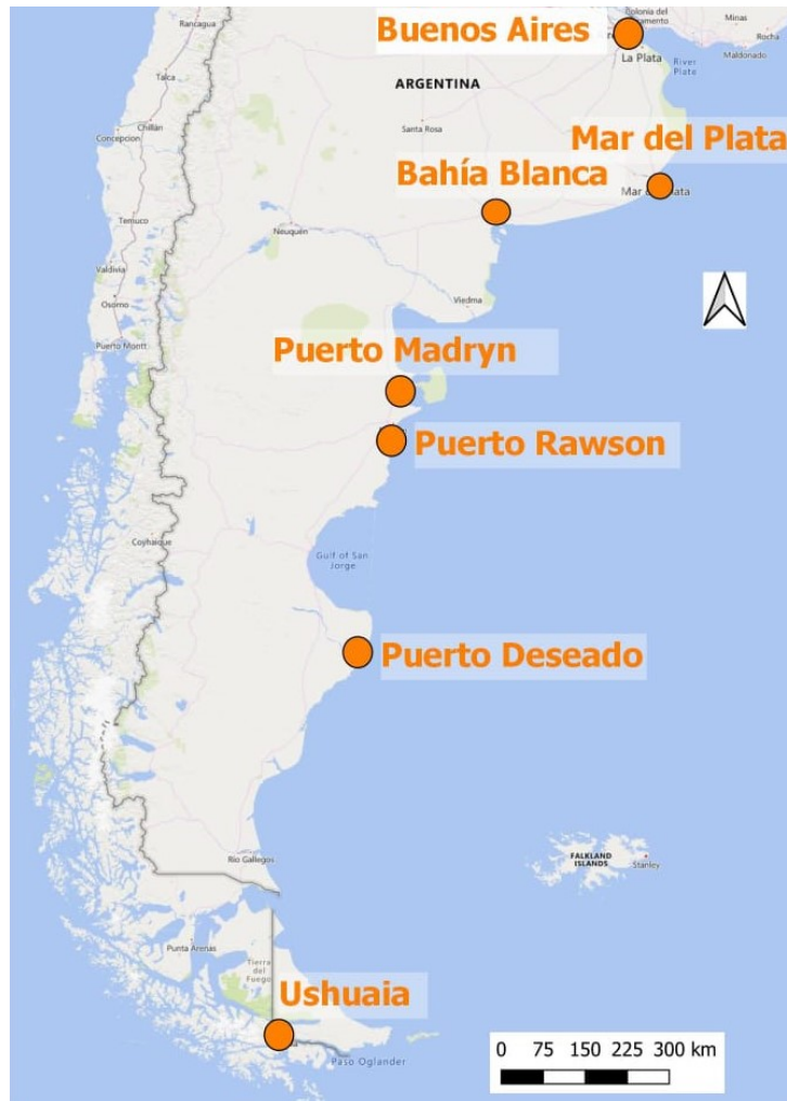
Mapa 1: Ubicación de Puerto Madryn en el sistema portuario del litoral atlántico argentino.